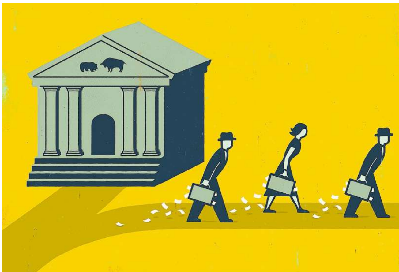
Es kann sich lohnen, die weniger flüssigen Vermögenswerte auch in den Blick zu nehmen.

Leveraged Fonds: Wer noch etwas mehr Rendite will, hält sich diese Fonds, die mit einem höheren Fremdkapital-