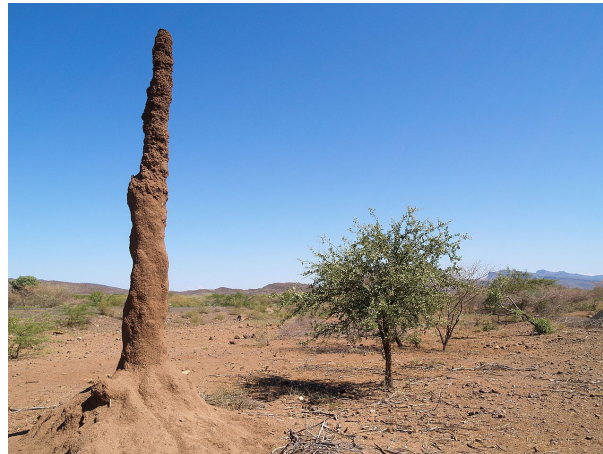
Drei Meter hoher Termitenhügel in Kenia.

Ohne zentralisierte Koordination bauen zum Beispiel Millionen von Termiten zusammen einen mehrere Meter hohen Hügel. Und während Heringe ohne Kontakt zu ihren Artgenossen orientierungslos und panisch reagieren, so sind sie im Schwarm ruhig und geschützt und verwirren ihre Fressfeinde.