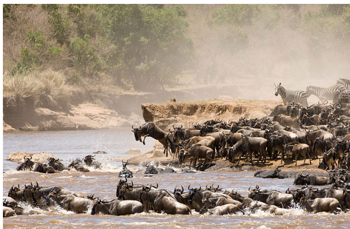
Gnus im Serengeti Nationalpark

Anlegen durch sogenanntes Social Trading oder Mitmach-Fonds ist ein weiteres Thema, wo gerne die Schwarmintelligenz ausgenutzt werden würde, aber in Tat und Wahrheit der Herdentrieb obsiegt. Beim Thema geht es um die Grundidee, dass der kleine Investor von den Grossen des Fachs abkupfern können sollte. Entweder werden Tipps von in der Vergangenheit erfolgreichen Tradern kopiert oder gleich deren ganzes Portfolio. Dabei werden allen Anlegern die gleichen Informationen zur Verfügung gestellt (Gleichschaltung!). Und ist der Experte wirklich ein solcher oder nur ein glücklicher Narr, der gerade einen Lauf hatte und dem nun alle blind nach rennen? Es kommt einem das Bild der Gnuherde in den Sinn, die den reissenden Fluss voller Krokodile an der tiefsten Stelle traversiert, nur weil ein einzelnes Tier zufällig ins Wasser geht und zuerst drei weitere folgen, und schliesslich alle Gnus weiter schwimmen müssen, um nicht von der von hinten drängenden Herde zertrampelt zu werden.