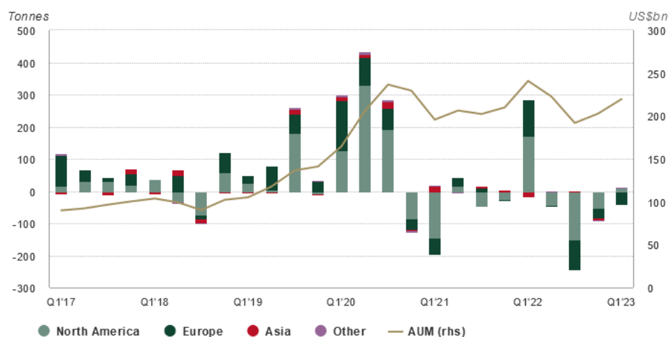
Die Balken zeigen die Nettokäufe und -verkäufe von physischen Gold-ETF in verschiedenen Weltregionen.

Umso mehr erstaunt es, dass die Anleger heute erstaunlich wenig Interesse an Gold zeigen. Seit mehr als zwei Jahren verzeichnen Gold-ETF sogar Mittelabflüsse, nur unterbrochen von einem kurzen Anstieg nach Russlands Angriff auf die Ukraine im 1. Quartal 2022 (siehe Grafik unten). Doch die momentane Unbeliebtheit von Gold ist ein gutes Zeichen für den antizyklischen Investor: Offensichtlich rechnen noch nicht alle Anleger mit dem Schlimmsten, was bedeutet, dass die Absicherung billig zu haben ist.